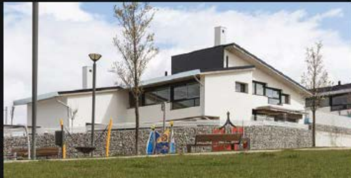
CASAS JARDÍN - BOADILLA DEL MONTE