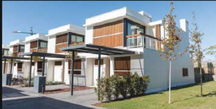
VILLAS BLANCAS - BOADILLA DEL MONTE