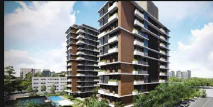
TORRES ATALAYA DE LA DEHESA - DEHESA DE LA VILLA, MADRID