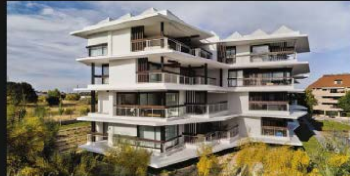
EDIFICIO ACANTILADO - BOADILLA DEL MONTE